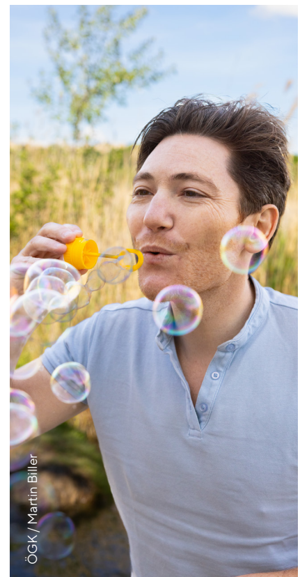
ÖGK / Martin Biller

Alle Infos gibt es unter www.gesundheitskasse.at/nikotinfrei und www.rauchfrei.at