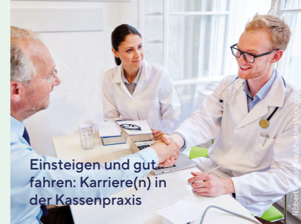
Einsteigen und gut fahren: Karriere(n) in der Kassenpraxis